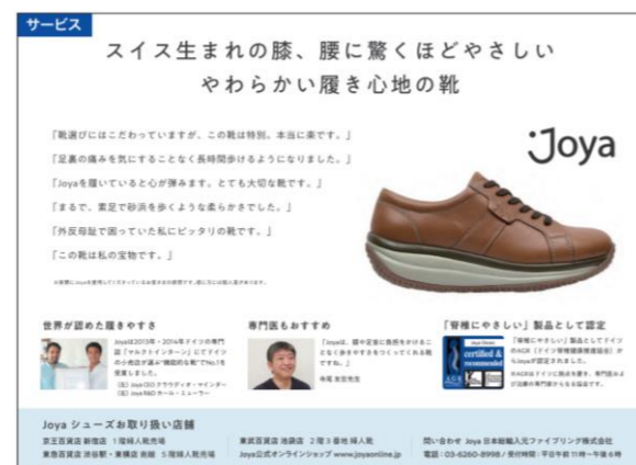
▲フォーマット広告1/2ページ例