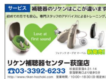
▲フォーマット広告 1/8ページ例